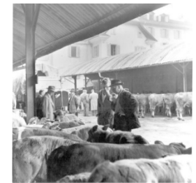
Viehmarkt im Bruchquartier Foto: Max A. Wyss (1955) Stadtarchiv Luzern

10 Geschichten, Thema Geschichte, Dauer: 40 min