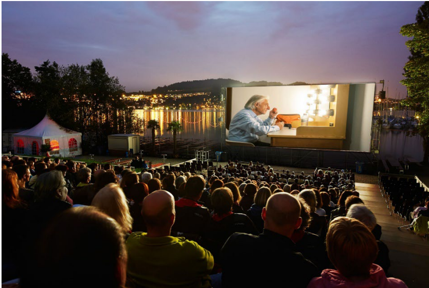
Open Air Kino Luzern; Foto: Open Air Kino Luna AG