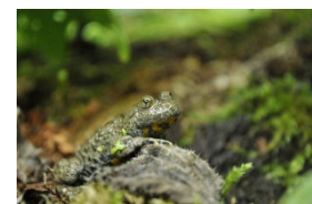
Gelbbauchunke, Dominik Henseler (2024)

9 Geschichten, Thema Natur-Geschichte, Dauer: 1h 30 min